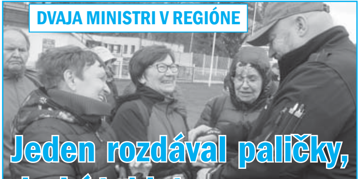
DVAJA MINISTRI V REGIÓNE