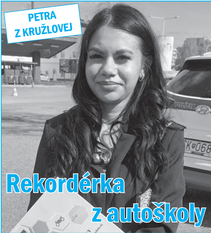
PETRA Z KRUŽLOVEJ

www.podduklianskenovinky.sk / redakcia@podduklianskenovinky.sk www.facebook.com/Podduklianskenovinky