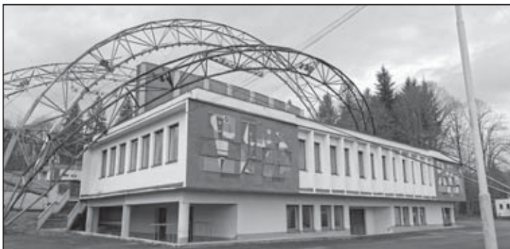
Súčasťou projektu rekonštrukcie amfiteátra je modernizácia a debarierizácia vnútorných priestorov

V rámci budovy amfiteátra je v pláne modernizácia druhého nadzemného podlažia, kde sa nachádzajú priestory šatní, vrátane umyvárne a WC samostatne pre mužov a ženy, spoločenská miestnosť, ekonomat a komunikačné priestory. Súčasný priestor umyvárne a WC sú nevyhovujúce, kde dochádza k zatekaniu vody pod existujúce linoleum na podlahe, na stenách chýba kera-