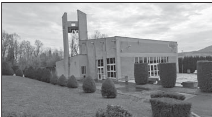
Ak bude projekt Technických služieb úspešný, zmení by budovu Domu smútku na moderný a mimoriadne úsporný priestor...