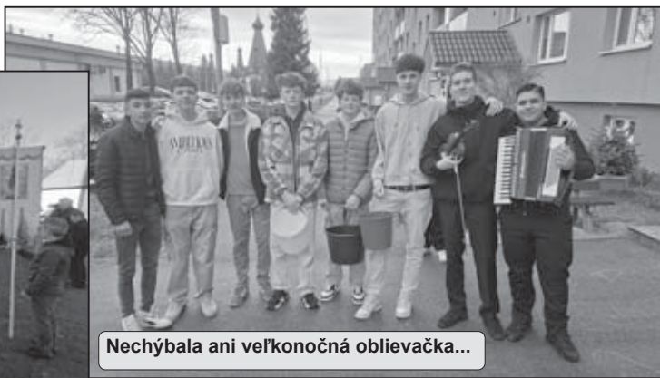
Nechýbala ani veľkonočná oblievačka...