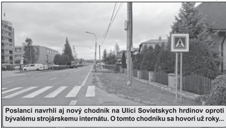
Poslanci navrhli aj nový chodník na Ulici Sovietskych hrdinov oproti bývalému strojárskemu internátu. O tomto chodníku sa hovorí už roky...