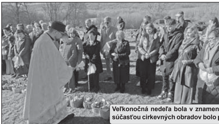
Veľkonočná nedeľa bola v znamení slávenia vzkriesenia Ježiša Krista a súčasťou cirkevných obradov bolo posväcovanie veľkonočných pokrmov.