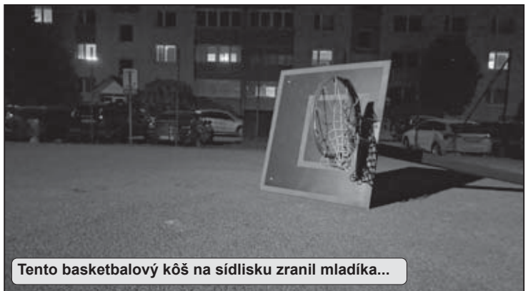
Tento basketbalový kôš na sídlisku zranil mladíka...