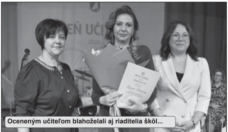
Oceneným učiteľom blahoželali aj riaditelia škôl...