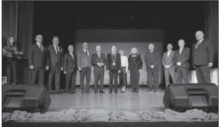
Slávnostné zasadnutia zastupiteľstva spojené s oceňovaním osobností a kolektívov sa v Stropkove konajú od roku 2004