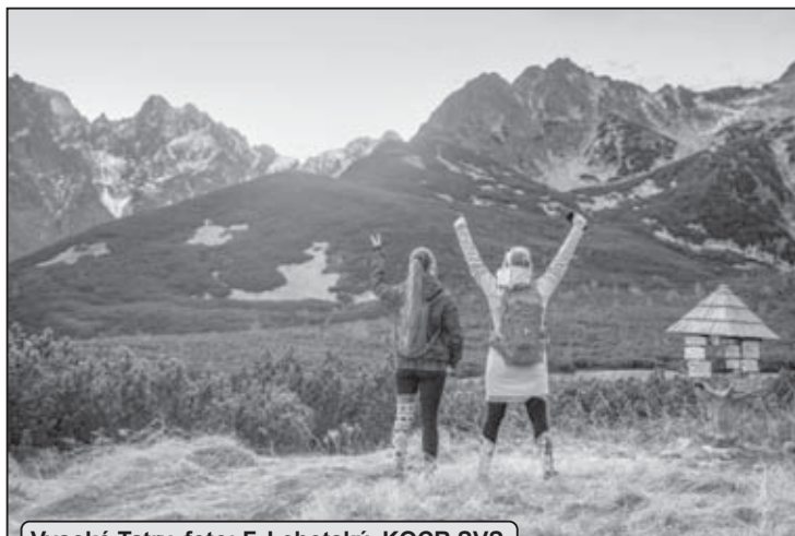
Vysoké Tatry

Výrazne rastie záujem Poliakov, medziročne ich do Prešovského kraja prišlo o 27 % viac. Po českých návštevníkoch sú druhými najčastejšími zahraničnými návštevníkmi PSK. Tretia priečka patrí Maďarom, nasleduje Ukrajina,