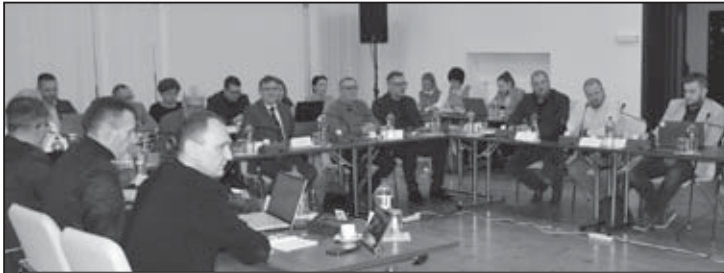
Mestské zastupiteľstvo vo Svidníku schválilo aj prijatie termínovaného úveru vo výške 25 000 eur na realizáciu nových miestnych komunikácií

Postupne schválili prijatie termínovaného úveru vo výške 663 000 eur na krytie kapitálových výdavkov mesta Svidník za účelom Rekonštrukcie nájomných bytov (Stavebná úprava nájomných bytov bytovom dome v meste Svidník, ktoré nezodpovedajú základným požiadavkám na stavby), teda niekdajšieho internátu SOU strojárského, ďalej prijatie termínovaného úveru vo výške 79 800 eur na krytie kapitálových výdavkov mesta Svidník za účelom rekonštrukcie krytej plavárne (Znižovanie energetickej náročnosti Krytej plavárne pri ZŠ 8. mája vo Svidníku), rovnako prijatie termínovaného