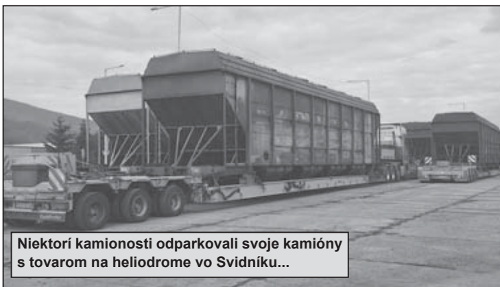
Niektorí kamionisti odparkovali svoje kamióny s tovarom na heliodrome vo Svidníku...