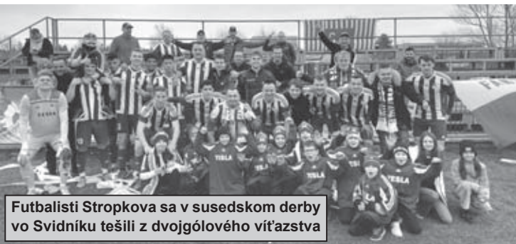
Futbalisti Stropkova sa v susedskom derby vo Svidníku tešili z dvojgólového víťazstva