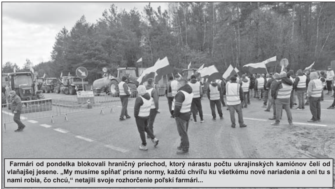
Farmári od pondelka blokovali hraničný priechod, ktorý nárastu počtu ukrajinských kamiónov čelí od vlaňajšej jesene. „My musíme spíňať prísne normy, každú chvíľu ku všetkému nové nariadenia a oni tu s nami robia, čo chcú,“ netajili svoje rozhorčenie poľskí farmári...

odišli, tvrdili, že svoje posledné slovo istočne nepovedali. Naspäť vraj otočili desiatky kamiónov.