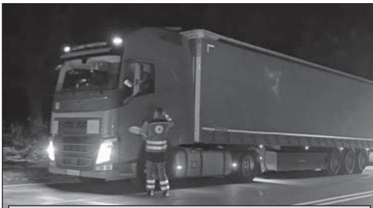
S jednoduchým občerstvením prišli na pomoc kamionistom čakajúcim v kolónach pracovníci zo svidnického územného spolku Slovenského Červeného kríža...

Dá sa tak skonštatovať, že snaha blokovať vjazd kamiónov, ktoré cez Slovensko do Poľska mohli prípadne dovážať poľnohospodárske produkty z Ukrajiny, sa postupne mihala účinkom. Hoci vo štvrtok popoludní poľskí farmári z hranice