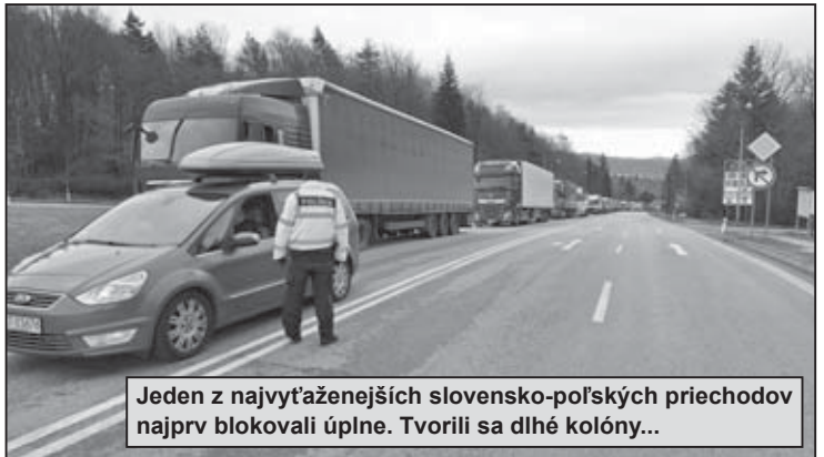
Jeden z najvyťaženejších slovensko-poľských priechodov najprv blokovali úplne. Tvorili sa dlhé kolóny...

V smere od hranice do nášho vnútrozemia sa tvorili dlhočizné kolóny kamiónov. Osobné autá, či dodávky protestujúci púšťali, no na zdržanie sa museli