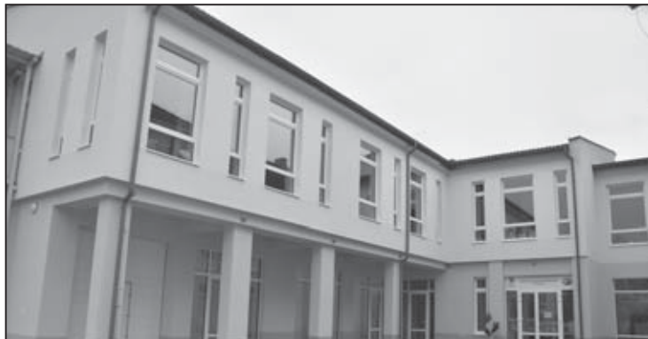
Podduklianske osvetové stredisko vo Svidníku zaznamenalo po ničivej prírodnej katastrofe praskliny na stenách, najmä v spojoch medzi novou a starou budovou a poškodené boli aj schody v starom objekte a obklady v budove prístavby...