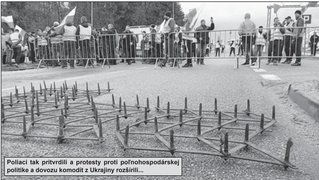
Poliaci tak pritvrdili a protesty proti poľnohospodárskej politike a dovozu komodít z Ukrajiny rozšírili...