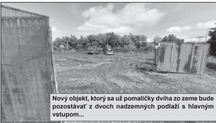
Nový objekt, ktorý sa už pomaličky dvíha zo zeme bude pozostávať z dvoch nadzemných podlaží s hlavným vstupom...