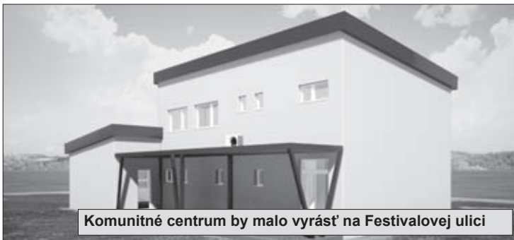
Komunitné centrum by malo vyrásť na Festivalovej ulici

Nový objekt bude vybudovaný na Festivalovej ulici. Objekt bude pozostávať z dvoch nadzemných podlaží s hlavným vstupom. Na prvom nadzemnom podlaží sa bude nachádzať hlavná kancelária pre komunitných pracovníkov, sociálne