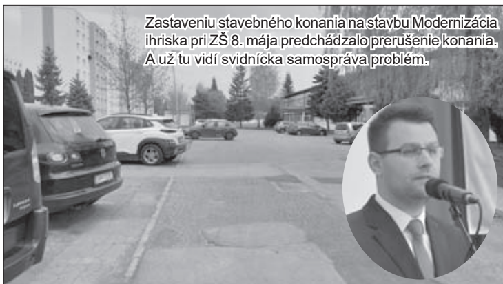
Zastaveniu stavebného konania na stavbu Modernizácia ihriska pri ZŠ 8. mája predchádzalo prerušenie konania. A už tu vidí svidnícka samospráva problém.