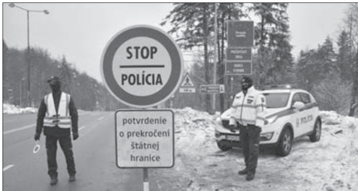
Cestujúci do Poľska však častokrát nemali prehľad o vyhláške Úradu verejného zdravotníctva a o platných nariadeniach či povinnostiach. Policajti museli preto trpezlivo vysvetľovať vyhlášku a pravidlá

V pondelok 15. decembra totiž Slovensko uzavrelo desať menších hraničných priechodov s Poľskom, okrem iných napríklad aj priechod Nižná Polianka - Ozenna, či hraničný priechod za obcou Kurov v smere na Krynicu. Očakával sa pritom zvýšený nápor práve na hraničný priechod Vyšný Komárnik - Barwinek, no o nejakom extra tlaku cestujúcich sa však