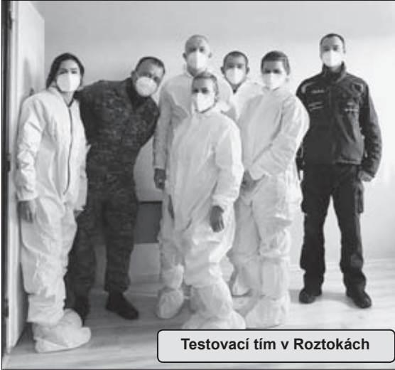
Testovací tím v Roztokách