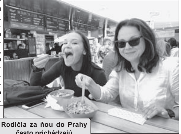
Rodičia za ňou do Prahy často prichádzajú

ľudmi a v podstate predať produkt, tak ma vzali a dali mi šancu. Práca je to veľmi zaujímavá. To, čo chcem robiť, to stále študujem,“ usmiala sa sym-