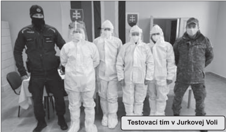
Testovací tím v Jurkovej Voli