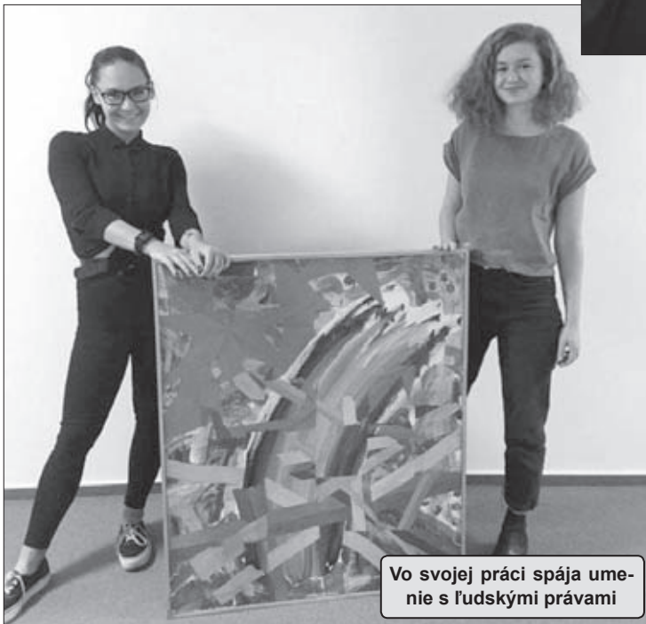
Vo svojej práci spája umenie s ľudskými právami