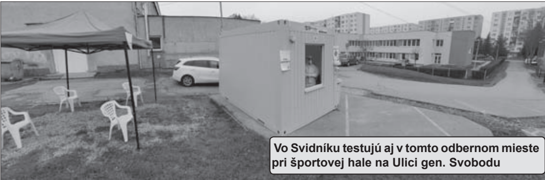
Vo Svidníku testujú aj v tomto odbernom mieste pri športovej hale na Ulici gen. Svobodu