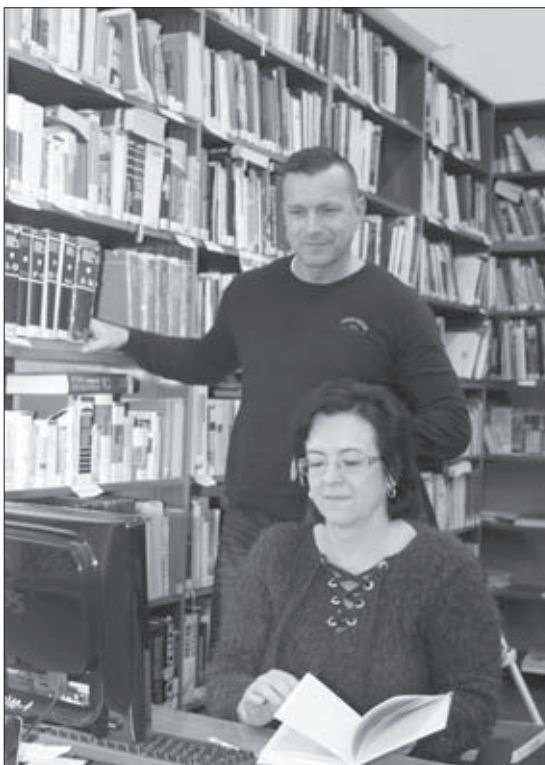
Čitatelia si môžu požičať na mesiac maximálne tri e-knihy, ktoré po dosiahnutí časového limitu z ich účtu zmiznú...