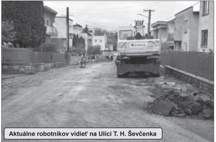
Aktuálne robotníkov vidieť na Ulici T. H. Ševčenka