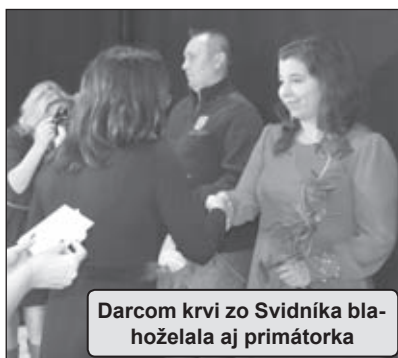
Darcom krvi zo Svidníka blahoželala aj primátorka