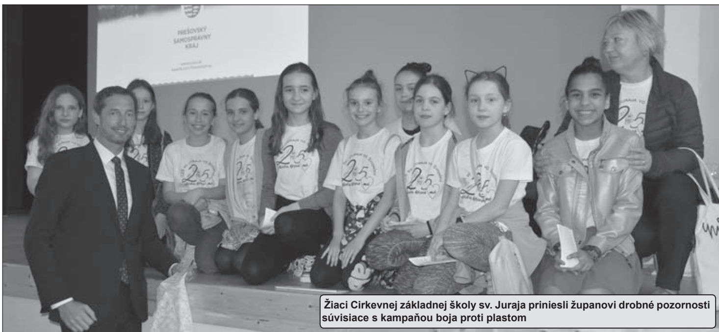
Žiaci Cirkevnej základnej školy sv. Juraja priniesli županovi drobné pozornosti súvisiace s kampaňou boja proti plastom