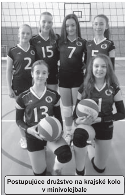
Postupujúce družstvo na krajské kolo v minivolejbale

jomných zápasov ešte v skupine sa hrali vyrovnané zápasy, dokonca trikrát sme postupujúce družstvá dokázali zdolať. Tri družstvá, ktoré postúpili z našej skupiny, momentálne tvoria prvú trojku finálovej deviatky. To je tento týždeň v skratke, ktorý priniesol tri postupy na krajské kolo a zároveň sme na dobrej ceste aj na Majstrovstvá Slovenskej republiky. Uvidíme.