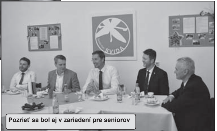
Pozrieť sa bol aj v zariadení pre seniorov

„Ak príde niektorý z týchto našich vedúcich zamestnancov do dôchodkového veku, tak, samozrejme, poďakujeme za dlhoročnú prácu. Naozaj, ak tam je všeobecná spokojnosť, tak nie je v pláne niekoho prepúšťať alebo škandalizovať, toto určite nie je môj štýl.“ (ps)