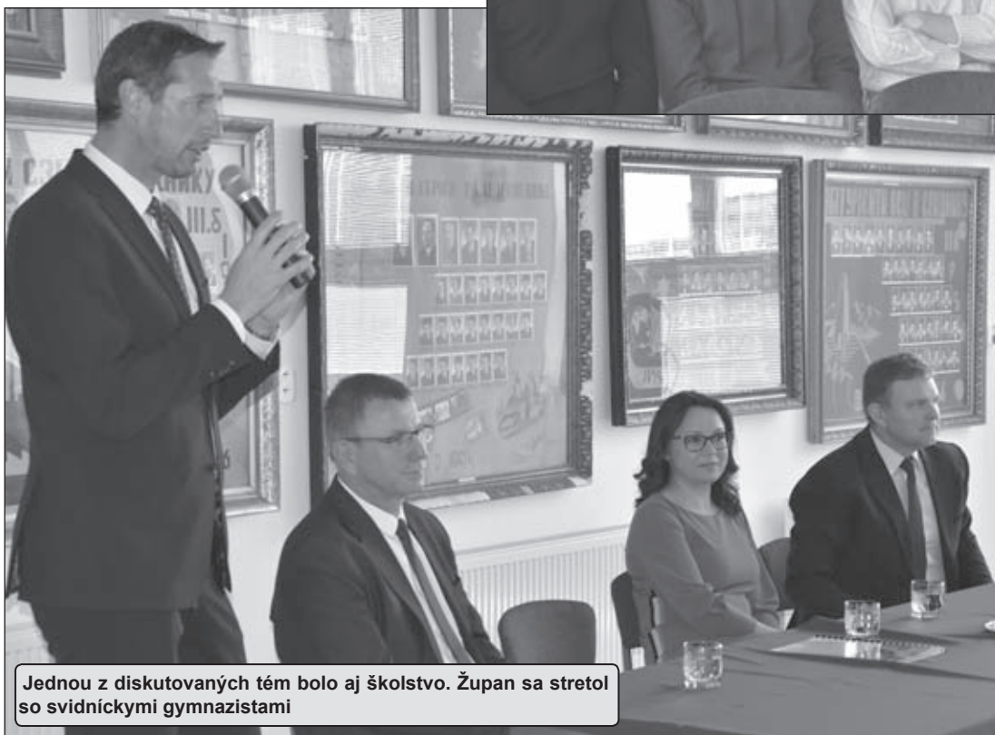
Jednou z diskutovaných tém bolo aj školstvo. Župan sa stretol so svidníckymi gymnazistami

„Ambíciou samosprávy je školy v celom kraji optimalizovať, predovšetkým ich zlučovať a pritom zachovávať žiadané odbory. Cieľom je vytvoriť lepšie podmienky pre žiakov a pedagógov, zároveň efektívne využívať budovy a skvalitňovať vyučovací proces. Verím, že regulácia počtu škôl nebude strašiakom, ale nevyhnutným opatrením, ktoré bude rešpektovať klesajúci demografický vývoj, potreby trhu práce a napokon aj volanie po kvalitnom školstve,“ uviedol predseda kraja. Ten informoval, že zmenou zriaďovateľa - z PSK na mesto Giraltovce, by malo prejsť aj Gymnázium v Giraltovciach.