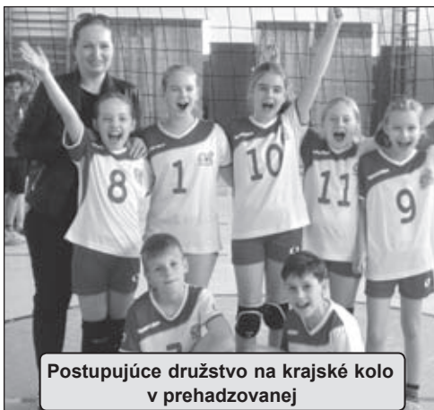
Postupujúce družstvo na krajské kolo v prehadzovanej

8. mája a ZŠ Mlynská zo Stropkova. Teší najmä fakt, že dokázali poraziť stropkovské siedmačky, napriek tomu, že družstvo tvorili najmä šiestiačky, jedna piatačka a len jedna siedmačka. V závere týždňa ukončili sezónu siedmačky. V „exhibičnom“ duchu odohrali posledné zápasy vo 4kovom volejbale o umiestnenie. Hoci im patrí len 10. miesto, počas sezóny si počínali pekne. Doplatili na veľmi silnú skupinu. Počas vzá-