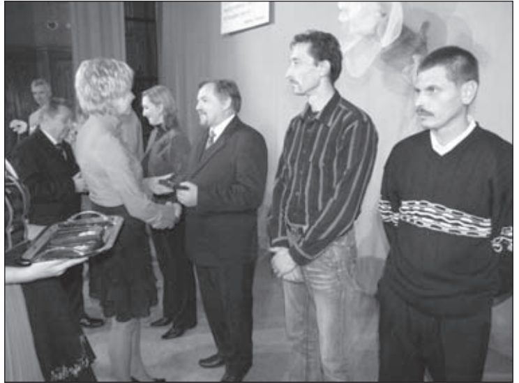
Uplynulý rok sa slávnosť oceňovanie bezpríspevkových darcov krvi plaketami prof. MUDr. Jana Janského za mnohonásobné darovanie krvi konala vo Svidníku, tento rok to budú Giraltoveci

Matka Tereza povedala: „ Sami cítite, že to, čo robíme je len kvapka v oceáne. Ale oceánu by niečo chýbalo, keby v ňom tá kvapka nebola. “ Podobne je to aj s darovaním krvi, preto si určite darci krvi, najmä tí mnohonásobní, zaslúžia ocenenie. (ks)