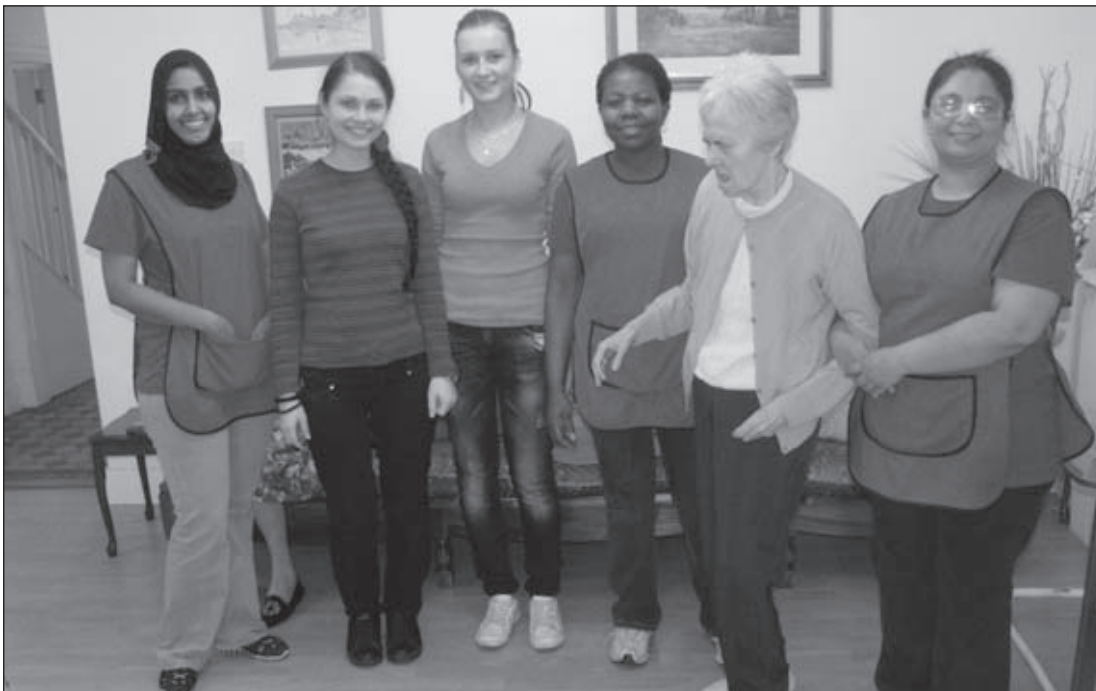
Študenti pracovali v ošetrovateľských domoch, kde získavali skúsenosti a zdokonaľovali sa v angličtine