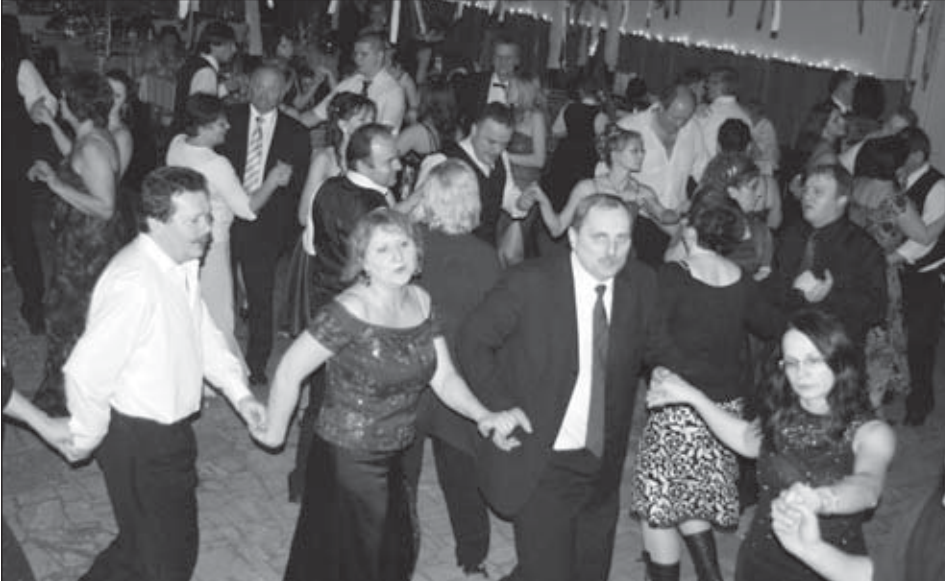
Na tradičnom Rusínskom silvestrovskom plese v Kružlovej vládla vynikajúca atmosféra