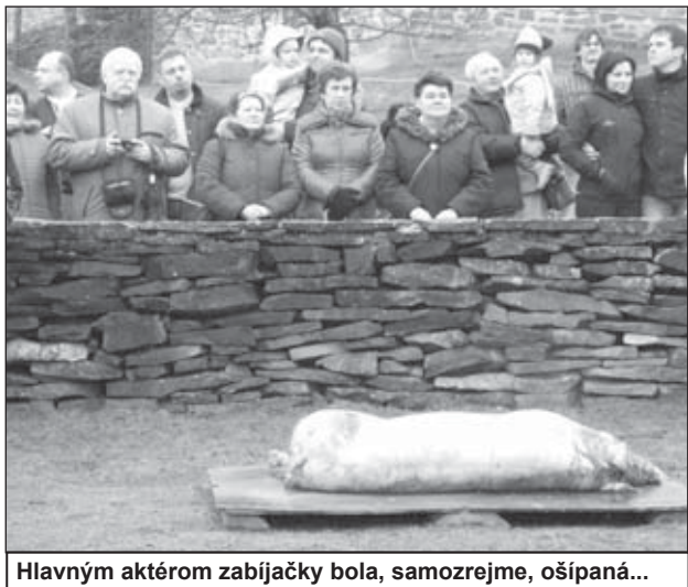
Hlavným aktérom zabíjačky bola, samozrejme, ošipaná...