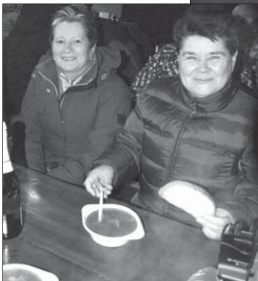
Silvestrovsko-novoročná zábava podľa Juliánskeho kalendára mala všetko, čo k takejto zábave patrí