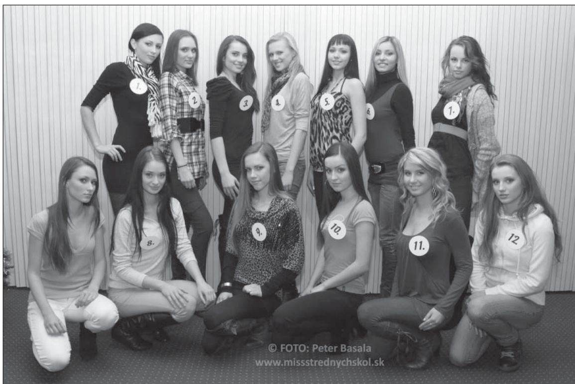
www.missstrednychskol.sk