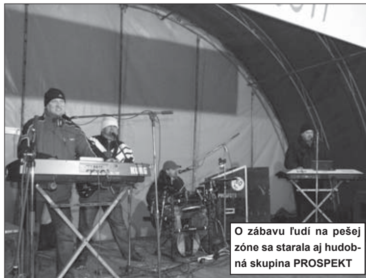
O zábavu ľudí na pešej zóne sa starala aj hudobná skupina PROSPEKT