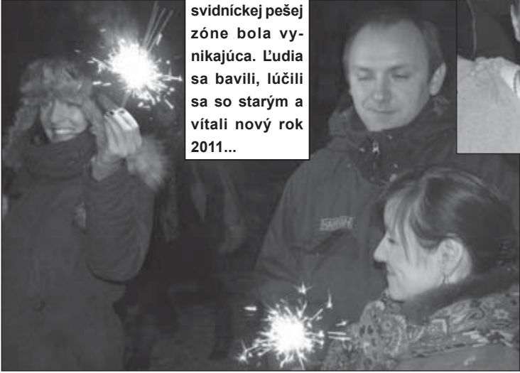
Atmosféra na svidnickej pešej zóne bola vynikajúca. Ľudia sa bavili, lúčili sa so starým a vítali nový rok 2011...