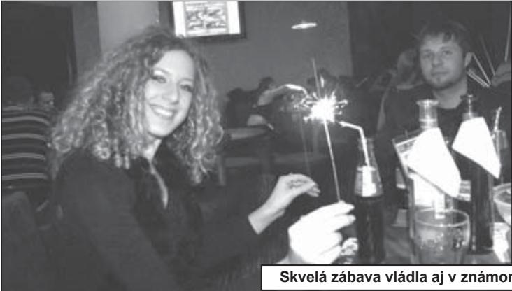
Skvelá zábava vládla aj v známom Infinity music clube vo Svidníku