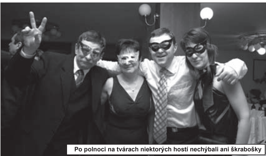
Po polnoci na tvárach niektorých hostí nechýbali ani škrabošky