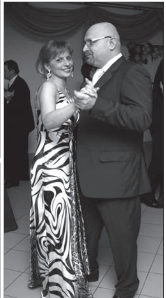
V sobotu sa vynikajúco bavili naozaj všetci. Napríklad aj manželka Vašutovci