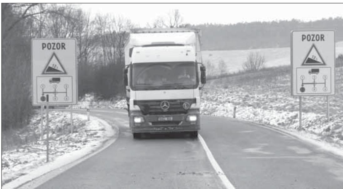
Nové nadštandardné dopravné značenie je orientované hlavne na kamióny a nákladné autá