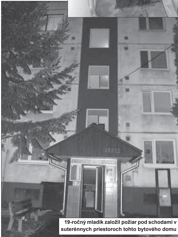
19-ročný mladík založil požiar pod schodami v suterénnych priestoroch tohto bytového domu