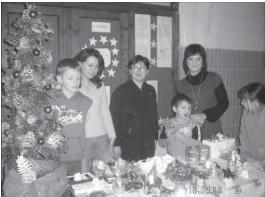
V Kračúnovciach zorganizovali Vianočný bazár a predávali tie najkrajšie výrobky žiakov všetkých tried miestnej Základnej školy