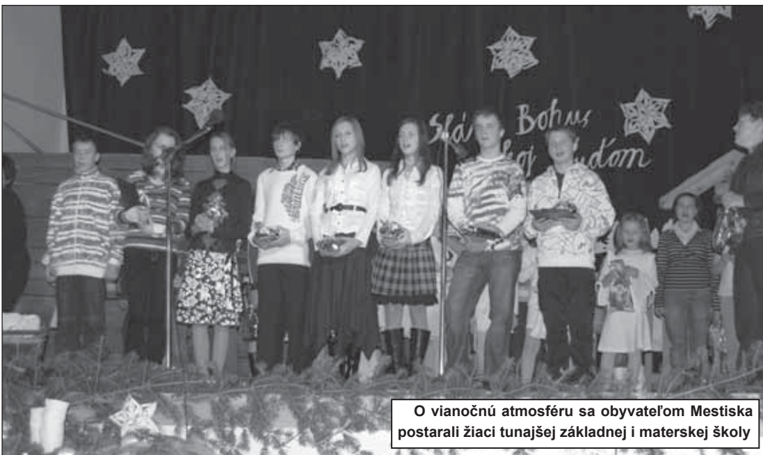
O vianočnú atmosféru sa obyvateľom Mestiska postarali žiaci tunajšej základnej i materskej školy